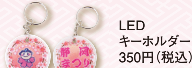
LEDキーホルダー 350円(税込)