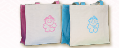
トートバッグ 1袋 500円(税込)